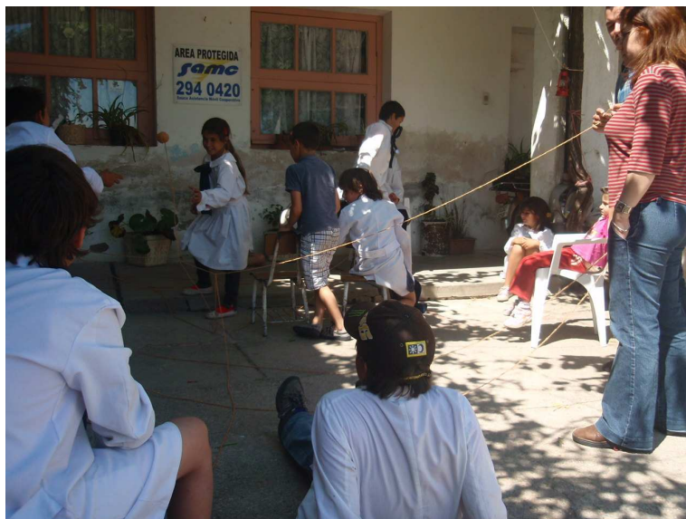
Actividad en Escuela Rural Cuchilla Machin