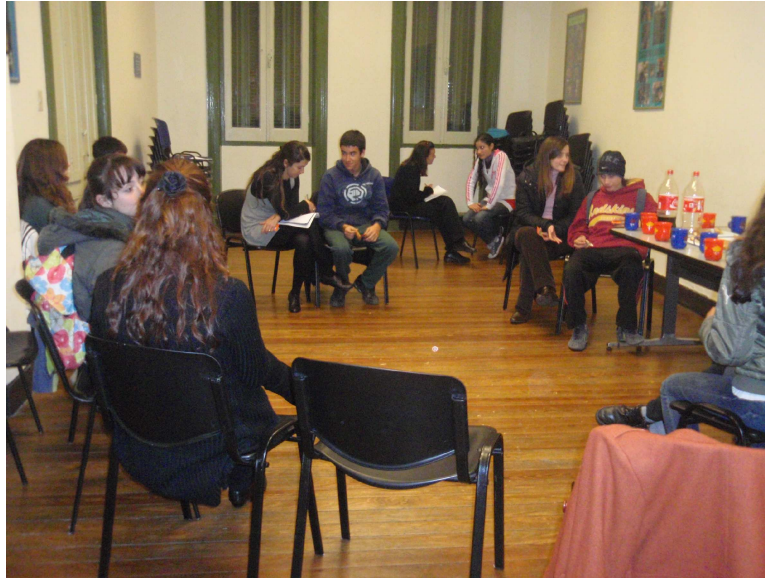
Encuentro Gurises Unidos – Centro Córdoba